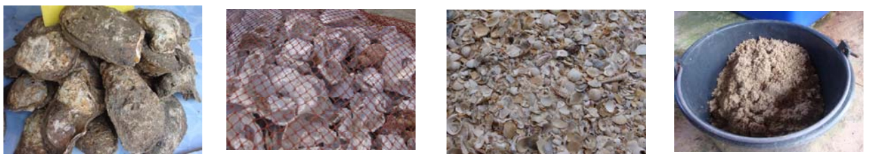
Oyster shells Oyster shells Seashells Sand