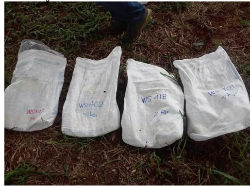
ภาพที่ 3 - 4 ปลูกข้าวโพดใช้เครื่องจักร โดยปลูกเรียงตามรหัสพันธุ์