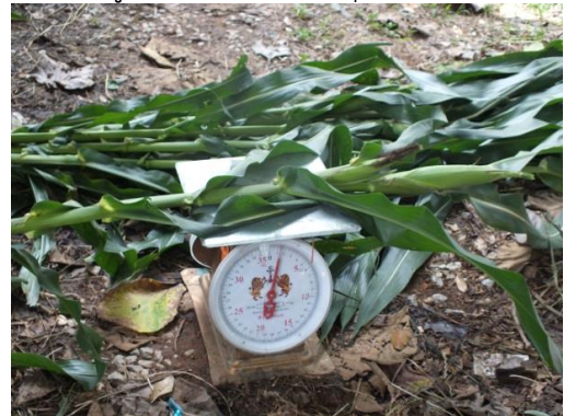
ภาพที่ 5 - 6 วัดการเจริญเติบโตและผลผลิตข้าวโพดแต่ละรหัสพันธุ์