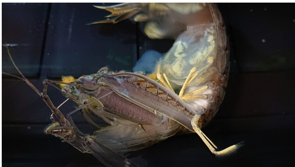
ภาพที่ 6 แม่พันธุ์กุ้งก้ามกรามที่ปล่อยไข่และสร้างเมือกสีขาวหุ้มมาหุ้มอย่างสมบูรณ์