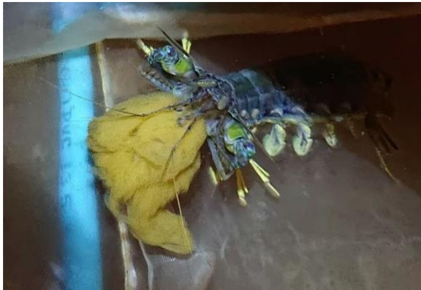
ภาพที่ 5 แม่พันธุ์กั้งที่ตกแตงที่ปล่อยไข่ออกมาแล้ว ถูกนำมาเลี้ยงในกระชังของระบบถึงฟักไข่ แม่พันธุ์จะดูแลไข่จนกระทั่งฟักออกเป็น nauplius

เมื่อแม่พันธุ์กั้งที่ตกแตงปล่อยไข่ออกมา 2 วัน นำแม่พันธุ์พร้อมไข่ เข้าระบบถึงฟักไข่ (ภาพที่ 6) ให้อาหารแม่กั้งตกแตง วันละ 1 ครั้ง สลับอาหารระหว่างกึ่งสดกับปลาสด เปลี่ยนถ่ายน้ำวันละ 1 ครั้ง ประมาณ 50 เปอร์เซ็นต์ ของปริมาณน้ำทั้งหมดในระบบ