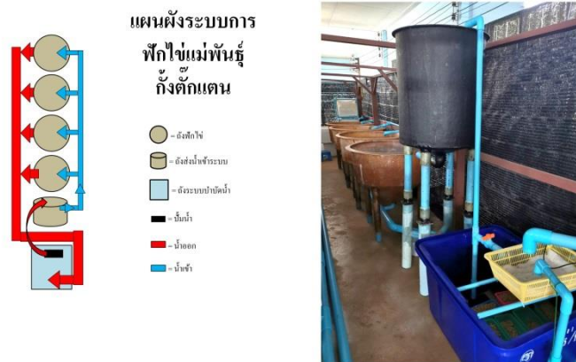
ภาพที่ 3 แผนผังทิศทางการไหลของน้ำในระบบถังฟักไข่แม่พันธุ์กิ้งกักแตน

อุณหภูมิ และมีสีทึบภูเขาไฟ และหินเกลบเผาอัด จำนวน 20 ลิตร ทำหน้าที่กรองชีวภาพ ลดแอมโมเนียและไนไตรท์ จากนั้นน้ำในถังบำบัดถูกปั๊มน้ำที่วางอยู่ภายใน สูบขึ้นไปยังถังขนาด 200 ลิตร ที่ต่อขायกสูงชัน เพื่อจ่ายน้ำไปยังถังฟักไข่ทั้ง 4 ใบ ทำให้ถังฟักไข่มีน้ำไหลผ่านอย่างต่อเนื่อง