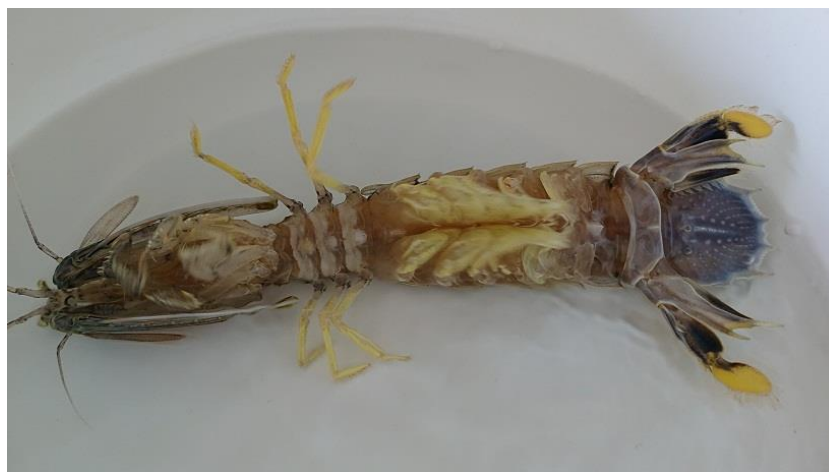
ภาพที่ 5 แม่พันธุ์กุ้งที่ติดแทนที่มีน้ำเชื้อเก็บไว้เต็มทั้ง 3 แถบ