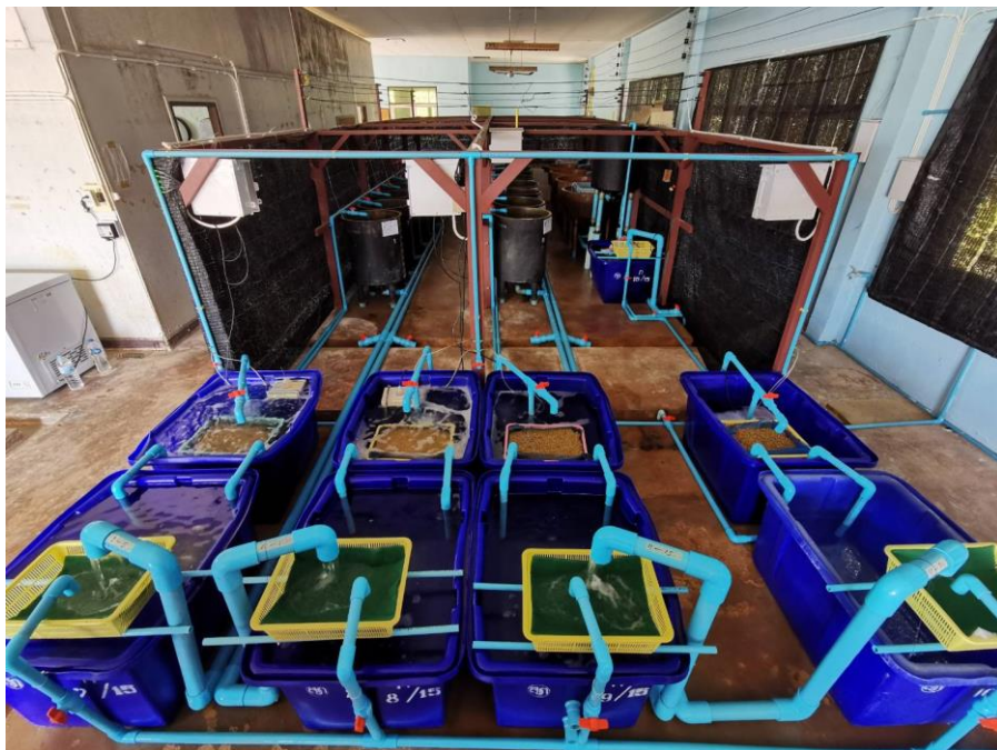
ภาพที่ 1 ระบบถังเลี้ยงแม่พันธุ์กิ้งกั๊กเตตน พร้อมระบบบำบัดน้ำ โดยทดลองให้มีช่วงเวลาน้ำไหลผ่านต่างกัน

2. ถังบำบัดมี 4 ชุด เช่นเดียวกับชุดถังเลี้ยง เชื่อมต่อกับถังเลี้ยงแบบชุดต่อชุด ถังบำบัดแต่ละชุดประกอบด้วยถังสี่เหลี่ยมขนาด 200 ลิตร 2 ไบ โดยไบแรกรับน้ำจากถังเลี้ยงทางท่อพีวีซีขนาด 2 นิ้ว ปลายท่อพีวีซีปรับยกสูงต่ำได้ เพื่อควบคุมระดับน้ำความสูงน้ำในถังเลี้ยง ในถังบำบัดไบแรกมีใยกรองหยาบสีเขียว และใยกรองละเอียดสีขาวรวม 2 ชั้น วางในตะกร้าตรงตำแหน่งที่น้ำจากถังเลี้ยงไหลลง เพื่อเก็บตะกอน เศษอาหาร และของเสียจากกิ้งกั๊กเตตน ภายในถังแรก วางหัวทรายให้อากาศเพื่อเพิ่มออกซิเจน น้ำและฮีทเตอร์เพื่อควบคุมอุณหภูมิ น้ำจากถังบำบัดไบที่ 1 ไหลไปถังบำบัดไบที่ 2 ซึ่งมีหินภูเขาไฟ และหินเกลบเผาอัด จำนวน 40 ลิตร ทำหน้าที่กรองชีวภาพ ลดแอมโมเนียและไนไตรท์ จากนั้นน้ำในถังบำบัดไบที่ 2 ถูกปั้มน้ำที่วางอยู่ภายใน สูบกลับไปยังถังเลี้ยงในอัตรา 1,350 ลิตร/ชั่วโมง หรือ 270 ลิตร/ชั่วโมง/ถัง ทำให้ถังเลี้ยงมีน้ำไหลผ่านอย่างต่อเนื่อง